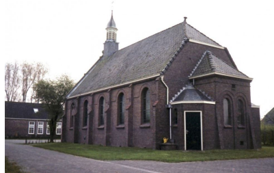
Achterzijde kerk voor de bouw van het Karkehüs.

Achter de kerk bevindt zich het Karkehüs. Het Karkehüs werd gebouwd in de tachtiger jaren van de vorige eeuw.