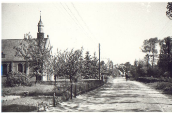
oude prentbriefkaart (1)

De kerk van Elsloo is in 1913 gerealiseerd naar een ontwerp van architect O.M. Meek en is een karakteristiek voorbeeld van werk uit de vroege periode van deze architect die in onze streek bijzonder veel heeft gebouwd.