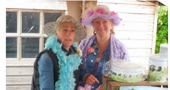
landelijke markt 2013

In 2013 bestond de kerk honderd jaar. Dat werd in mei gevierd. Op zaterdag 25 mei viel de viering samen met een landelijke markt die rond de kerk werd georganiseerd.