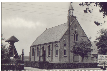
oude prentbriefkaart (2)

De kerk is van cultuurhistorisch belang vanwege de architectonische gaafheid, de esthetische kwaliteit van het ontwerp, het zeer bijzondere materiaalgebruik en de ornamentiek. Het kerkgebouw wordt gebruikt door de Streekgemeente Friesland's End. Onder die gemeente vallen de dorpen Boyl, Elsloo en Makkinga. Sinds de eenwording van drie landelijke kerken op 1 mei 2004 maakt de kerk deel uit van de Protestantse Kerk in Nederland. De kerk ligt op een ruim eigen erf en is van de openbare weg gescheiden door een gietijzeren hekwerk. Naast de kerk staat een klokkenstoel met twee klokken. Achter de kerk ligt het kerkhof.