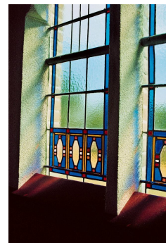
glas in lood lichtvenster

Het interieur van de kerk is vrijwel geheel oorspronkelijk en bestaat uit een voorportaal, de kerkzaal en de ruimte achter de preekstoel. Boven het voorportaal bevindt zich de orgelgalerij. De wanden zijn wit gepleisterd met ter hoogte van de aanzet van de vensterboog een sierlijst van afwisselend rode Groninger stenen en decoratieve verblendstenen. De ruimte wordt overspannen door een vlakke zoldering op een houten gebroken spant waaraan trekstaven hangen met stelverbindingen. In het plafond zijn vierkante luchtcirculatioeroosters aangebracht. Het bankenplan in de kerkzaal is vrijwel compleet en bestaat uit de oorspronkelijke kerkbanken. De kerkbanken bij de preekstoel hebben zijdeurtjes. Voor in de kerk staat een standaard met een historische bijbel. In het voorgedeelte staan de banken voor de kerkfunctionarissen. De preekstoel heeft een dubbele opgang en is vervaardigd van wit geglazuurde baksteen met een houten paneelkuip. Het ruggeschot is van hout. De olieverfschilderijen in de kerk zijn gemaakt door Hinke Harder uit Elsloo.