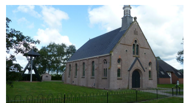
Hervormde Kerk Elsloo in 2013

Wie de kerk binnenkomt wordt verrast door de intieme sfeer. De banken zijn ossenbloedrood geschilderd en de kerk heeft enkele fraaie gebrandschilderde ramen. De preekstoel heeft aan de onderzijde opvallend metselwerk en biedt de voorganger de mogelijkheid de stoel links- of rechtsom te betreden. In de jaren tachtig van de vorige eeuw heeft de kerk haar huidige kleuren gekregen. In 1993 is de oorspronkelijke dakbedekking van zwart geglazuurde Lucas IJbrands pannen vervangen door Franse keramische daktegels.