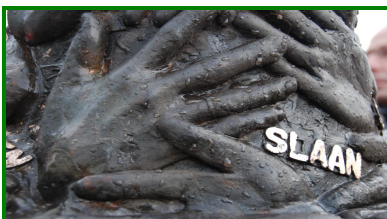
foto 3: Standbeeld Door en voor