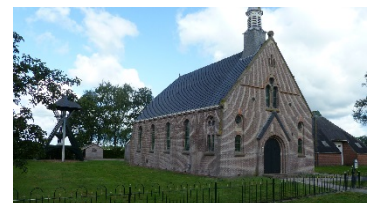
Hervormde Kerk Elsloo in 2013

Wie de kerk binnenkomt wordt verrast door de intieme sfeer. De banken zijn ossenbloedrood geschilderd en de kerk heeft enkele fraaie gebrandschilderde ramen. De preekstoel heeft aan de onderzijde opvallend metselwerk en biedt de voorganger de mogelijkheid de stoel links- of rechtsom te betreden. In de jaren tachtig van de vorige eeuw heeft de kerk haar huidige kleuren gekregen. In 1993 is de oorspronkelijke dakbedekking van zwart geglaazuurde Lucas IJbrands pannen vervangen door Franse keramische daktegels.