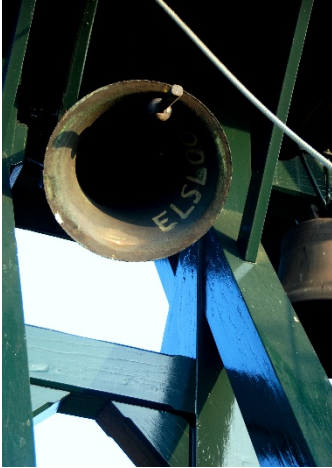
Klok uit 1954

De oudste klok dateert uit de vijftiende eeuw. De andere klok is in 1954 gegoten. In de binnenkant van de klok staat het woord Elsloo. De klokken van de klokkenstoel worden dagelijks om 9.00 door vrijwilligers geluid. Het is een gewoonte die door de bewoners van het dorp zeer wordt gewaardeerd.