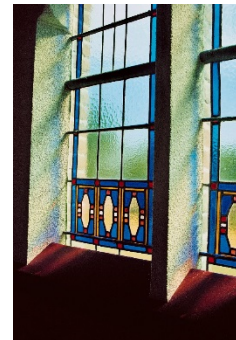
glas in lood lichtvenster

Het interieur van de kerk is vrijwel geheel oorspronkelijk en bestaat uit een voorportaal, de kerkzaal en de ruimte achter de preekstoel. Boven het voorportaal bevindt zich de orgelgalerij. De wanden zijn wit gepleisterd met ter hoogte van de aanzet van de vensterboog een sierlijst van afwisselend rode Groninger stenen en decoratieve verblendstenen. De ruimte wordt overspannen door een vlakke zoldering op een houten gebroken spant waaraan trekstaven hangen met stelverbindingen. In het plafond zijn vierkante luchtcirculatioeroosters aangebracht. Het bankenplan in de kerkzaal is vrijwel compleet en bestaat uit de oorspronkelijke kerkbanken. De kerkbanken bij de preekstoel hebben zijdeurtjes. Voor in de kerk staat een standaard met een historische bijbel. In het voorgedeelte staan de banken voor de kerkfunctionarissen. De preekstoel heeft een dubbele opgang en is vervaardigd van wit geglaazuurde baksteen met een houten paneelkuip. Het ruggeschot is van hout. De olieverfschilderijen in de kerk zijn gemaakt door Hinke Harder voormalig inwoner van Elsloo.