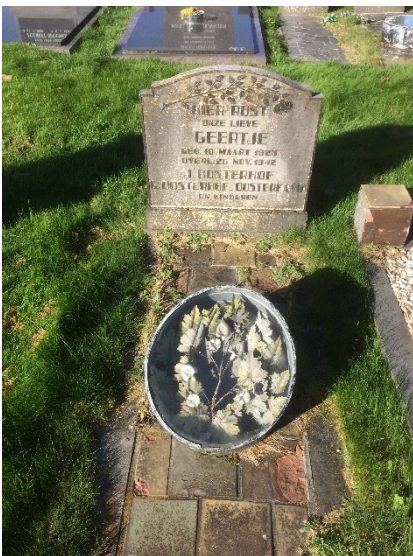
Graftrommel op begraafplaats Elsloo

Achter de kerk ligt de begraafplaats. De begraafplaats is eigendom van de Hervormde Gemeente Elsloo die de begraafplaats zelf beheert. Op de begraafplaats liggen een aantal unieke graftrommels die met een in 2017 ontvangen subsidie uit het Fonds Ooststellingwerf in de loop van 2017 zullen worden gerestaureerd.