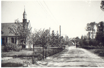
oude prentbriefkaart (1)

De kerk van Elsloo is in 1913 gerealiseerd naar een ontwerp van architect O.M. Meek en is een karakteristiek voorbeeld van werk uit de vroege periode van deze architect die in onze streek bijzonder veel heeft gebouwd.