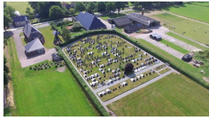
Begraafplaats Elsloo (Juni 2017)

Kijk voor meer info over de begraafplaats op de website van het LOB (Landelijk Overleg Begraafplaatsen). Op die website heeft de begraafplaats van Elsloo een eigen pagina..