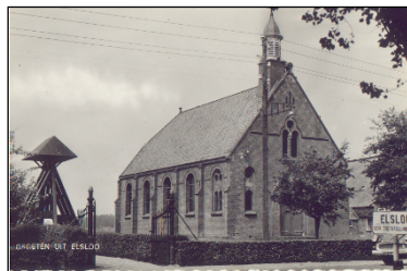
oude prentbriefkaart (2)

De kerk is van cultuurhistorisch belang vanwege de architectonische gaafheid, de esthetische kwaliteit van het ontwerp, het zeer bijzondere materiaalgebruik en de ornamentiek. Het kerkgebouw wordt gebruikt door de Streekgemeente Friesland's End. Onder die gemeente vallen kerkelijke Gemeenten van de dorpen Boyl, Elsloo en Makkinga. De kerk ligt op een ruim eigen erf en is van de openbare weg gescheiden door een gietijzeren hekwerk. Naast de kerk staat een klokkenstoel met twee klokken. Naast de voordeur staat een lantaren die de kerk in 2013 kreeg van de Hervormde Vrouwen Vereniging. Achter de kerk ligt de begraafplaats..