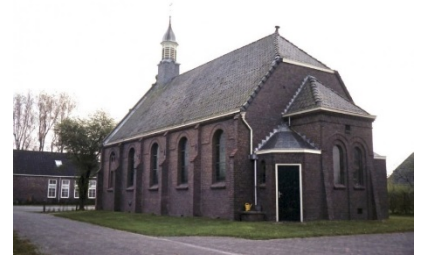
Achterzijde kerk voor de bouw van het Karkehûs.

Achter de kerk bevindt zich het Karkehûs. Het Karkehûs werd gebouwd in de tachtiger jaren van de vorige eeuw.